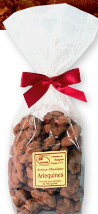
06.34 Sachet 250g