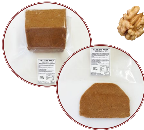
Pâte de Noix 33%