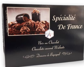
06.453 Spécialité de France 80g