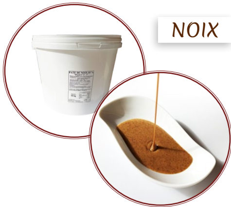
Pâte de Noix 85%