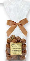
08.15 Sachet 150g