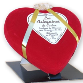
06.454 Boite Coeur 150g