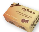
06.195 Ballotin 80g