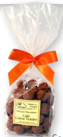
06.23 Sachet 150g