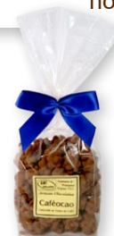
06.192 Sachet 150g

Véritable grain de café, chocolat noir et cacao