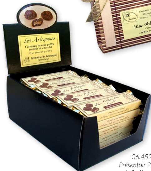
06.4521 Présentoir 25 étuis de 3 pièces 20g