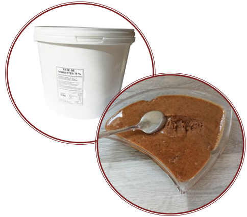
Pâte de Noisettes 75%