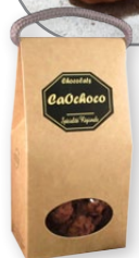
07.4800 Boîte kraft 100g