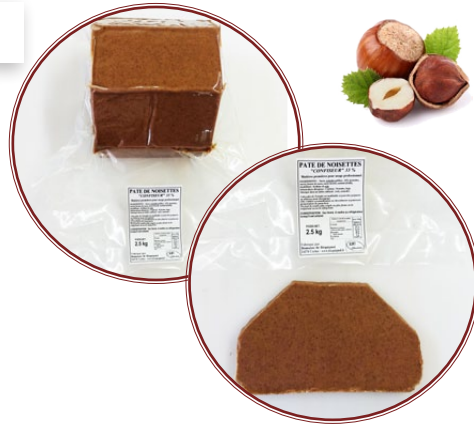
Pâte de Noisettes 33%