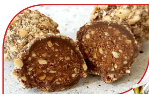
06.311 Sachet Rochers 150g