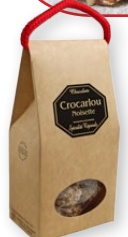
08.203 Boîte kraft 100g