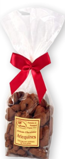
06.320 Sachet 110g