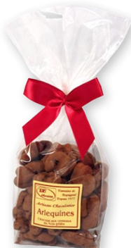
06.33 Sachet 150g