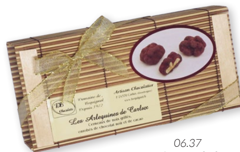
06.37 Boite store 250g