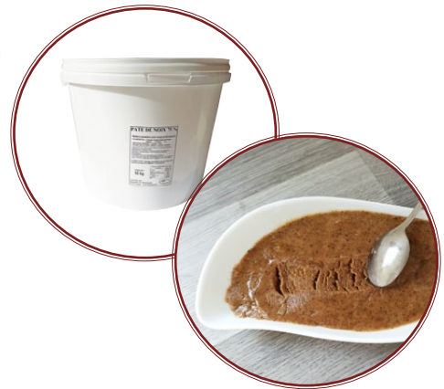
Pâte de Noix 75%