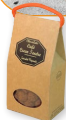
06.241 Boîte kraft 100g