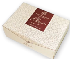
06.35 Ballotin Tiroir 100g