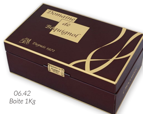
06.42 Boite 1Kg