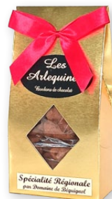
06.321 Triangle 100g