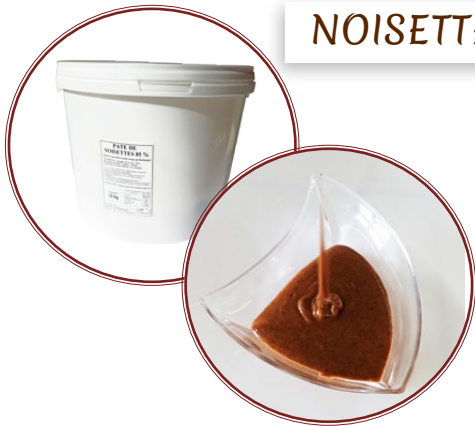
Pâte de Noisettes 85%