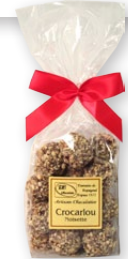
08.201 Sachet 130g