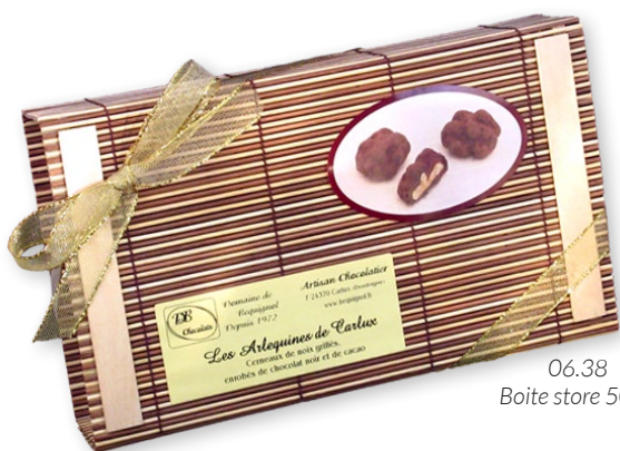
06.38 Boite store 500g