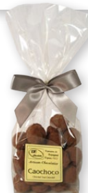
07.46 Sachet 150g