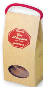
06.40 Boite kraft 100g